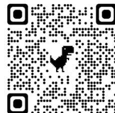
Zonas Comunidad de Madrid